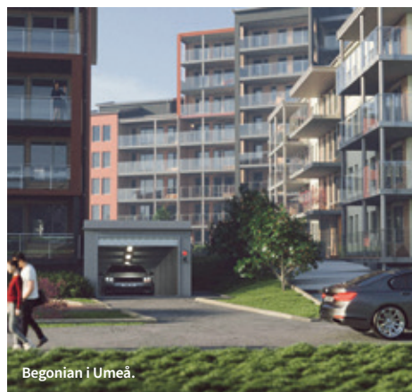
Begonian i Umeå.

Här är några av projekten som levereras före semester 2020.