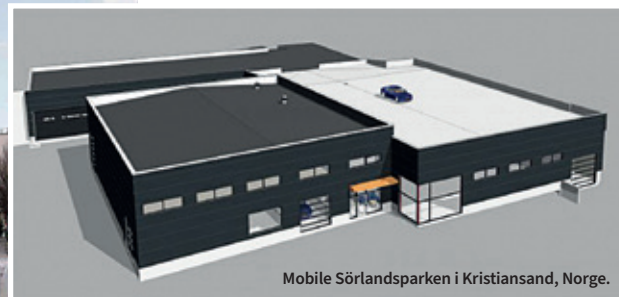
Mobile Sörlandsparken i Kristiansand, Norge.