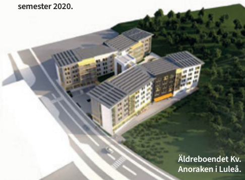
Äldreboendet Kv. Anoraken i Luleå.

Här är några av projekten som levereras före semester 2020.