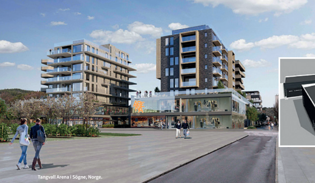
Tangvall Arena i Søgne, Norge.